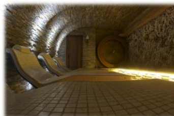
Spalme d'or pour le spa Les Violettes